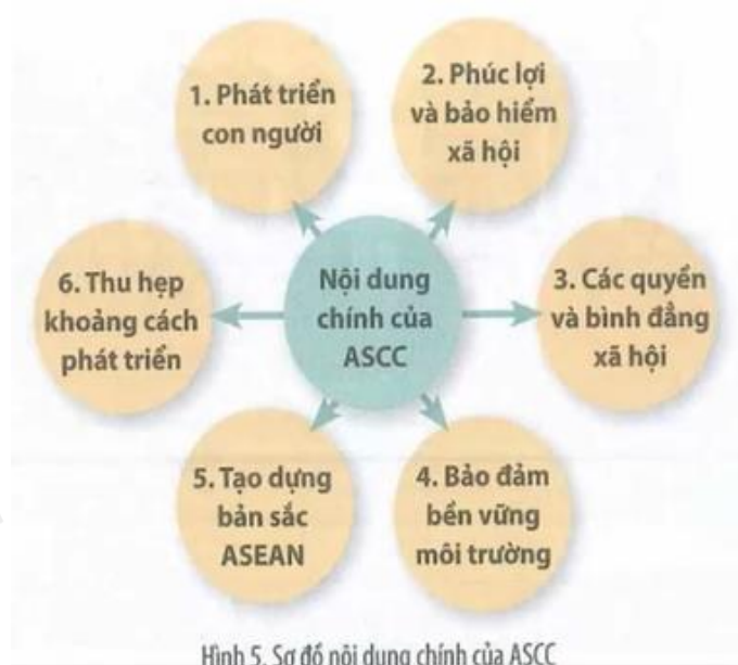
Hình 5. Sơ đồ nội dung chính của ASCC